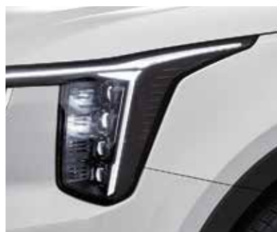
Проекционные светодиодные фары