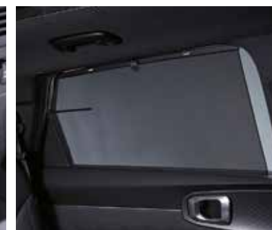
Солнцезащитные шторки для второго ряда сидений