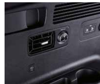
Кондиционер для третьего ряда сидений