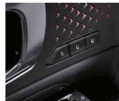
Память настроек сиденья водителя