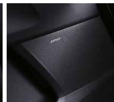
Аудиосистема премиум-класса Bose® с 12 динамиками