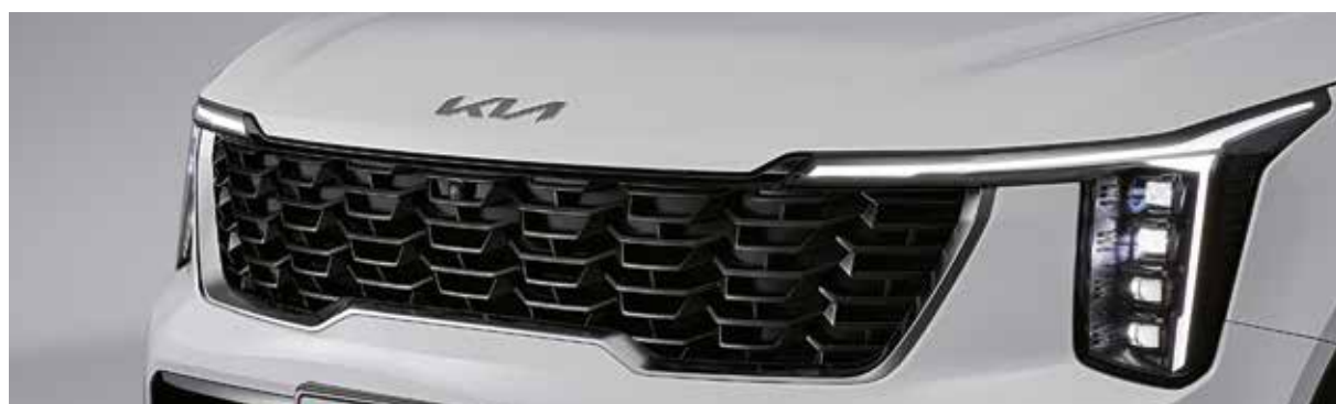
Решетка радиатора с отделкой черным глянцем