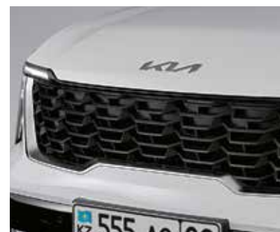
Черная решетка радиатора