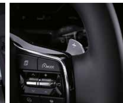
Подрулевые «лепестки» переключения передач