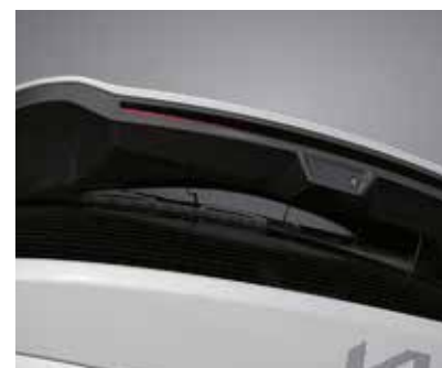
Скрытый стеклоочиститель на заднем стекле