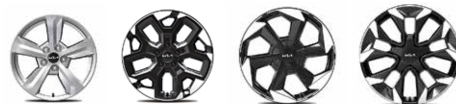
Легкосплавные диски 17"