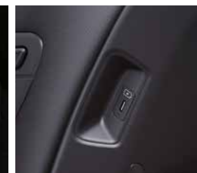
Дополнительные зарядные устройства USB в спинках сидений первого ряда