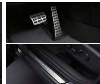
Металлические накладки на педалях / дверных порогах