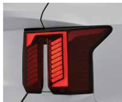
Светодиодные задние фонари