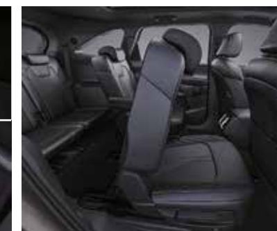
Облегченная система входа на второй ряд одним нажатием кнопки