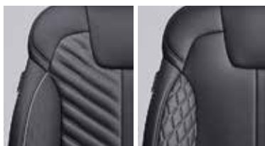
Кожа сорта Нарра с прострочкой