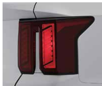
Обычные задние фонари