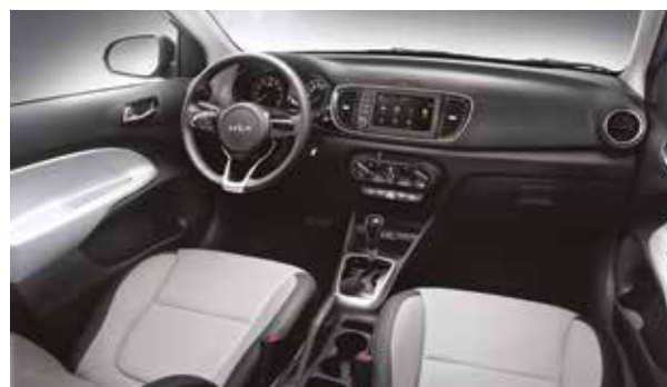
Қара (бір түсті)