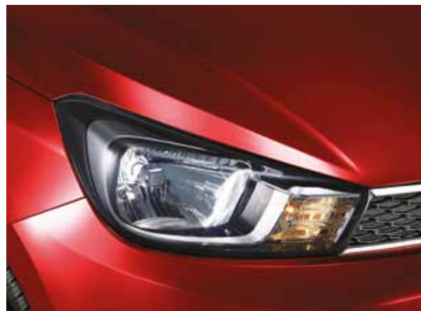
Алдыңғы фаралары айқын

Шанағындағы спорттық сызықтар адамды бей-жай қалдырмайтын динамикалық сұлба қалыптастырады.