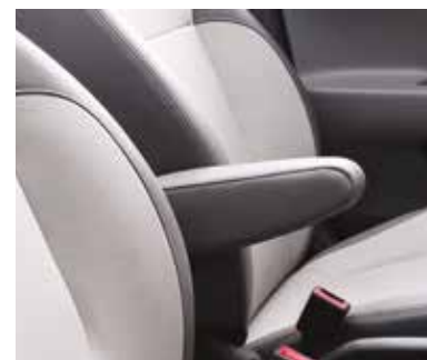
Алдыңғы шынтақ қойғыш