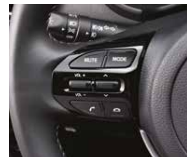
Аудиожүйені руль арқылы басқару түймешелері