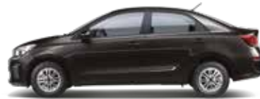
Aurora Black Pearl