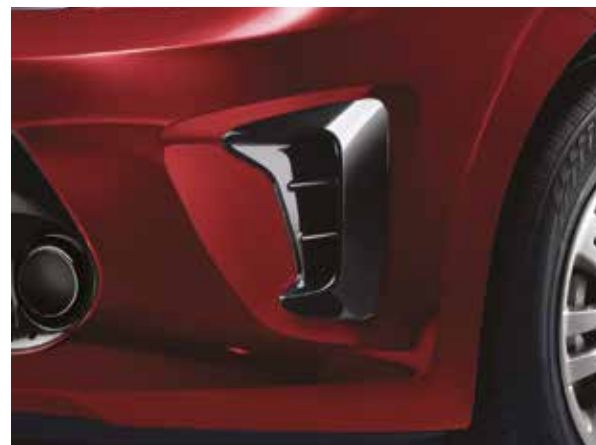
Екпінді ауа өткізгіштер