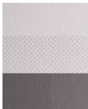
Сұр (екі түсті) былғары