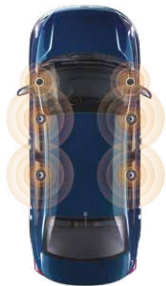
6 динамигі бар аудиожүйе