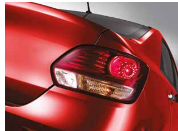
Артқы фараларының дизайны тыңғылықты