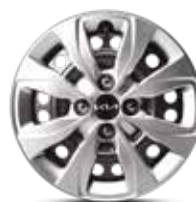
14" болат диск