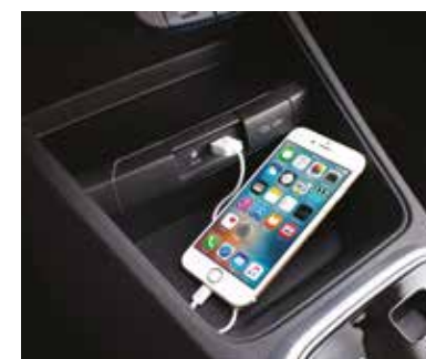
AUX және USB порттары бар екі ярусты бөлік