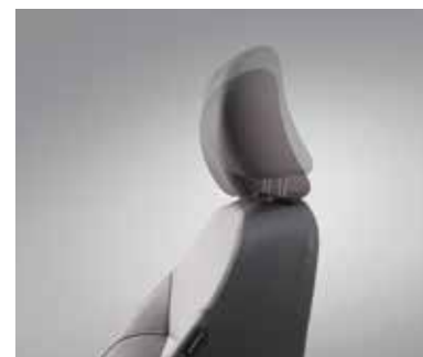
Алдыңғы бас тіректі биіктігі бойынша реттеу