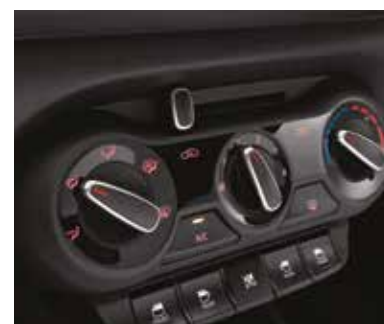
Қолмен басқарылатын кондиционер