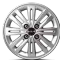
14" жеңіл қорытпалы диск